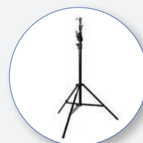
SA 21 Tripé