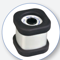
SV 34 Classe 2 Calibrador Acústico 114 dB at 1 kHz