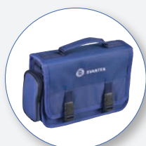
SA 47M Bolsa de transporte Material de tecido