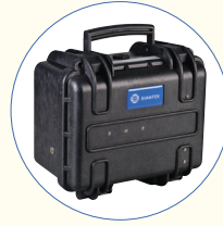
SB 270_EB Externer Akku 33 Ah