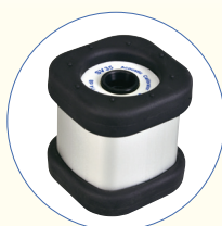
SV 35A Class 1 Akustischer Kalibrator 94 dB / 114 dB