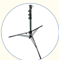
SA 206 Mikrofonmast